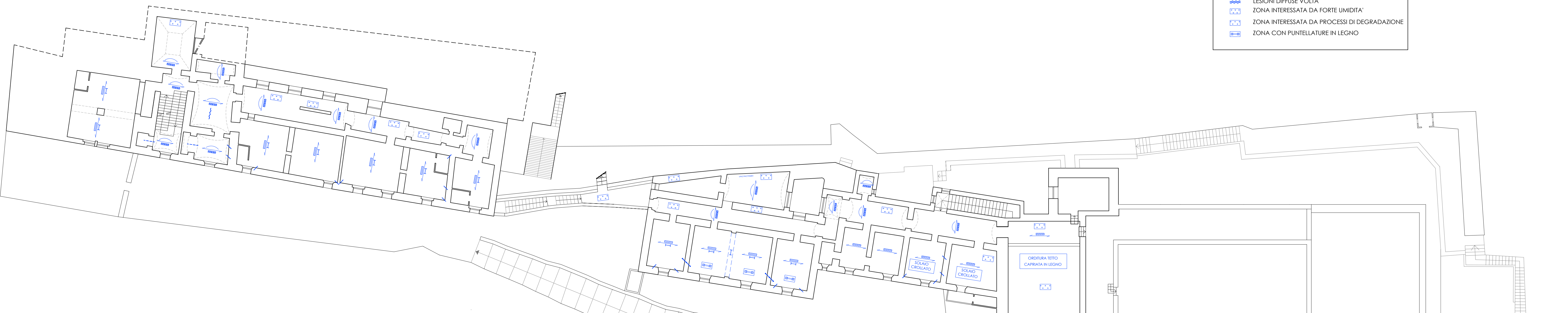
PIANTA SECONDO LIVELLO San Pietro a Maiella e San Giacomo