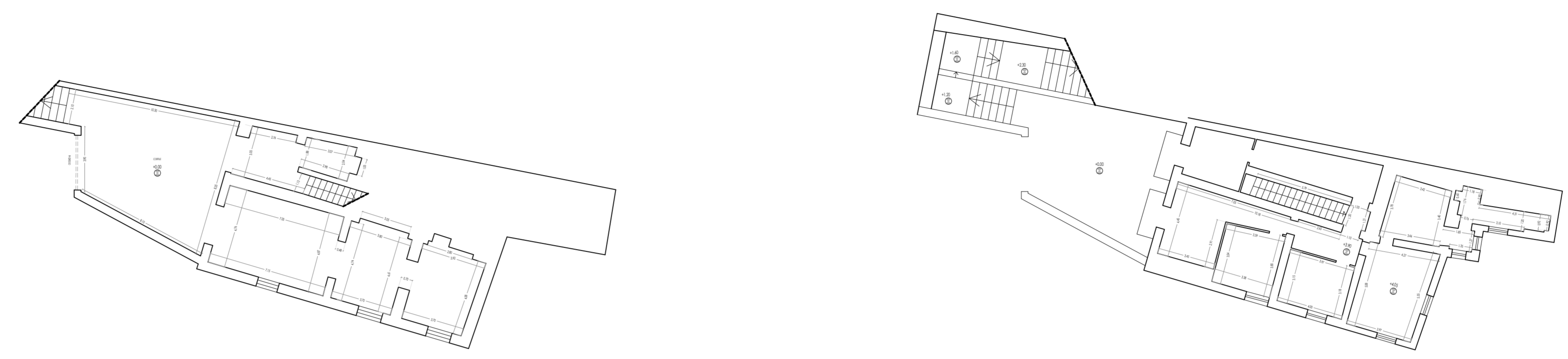
PIANTA QUOTA +0.00