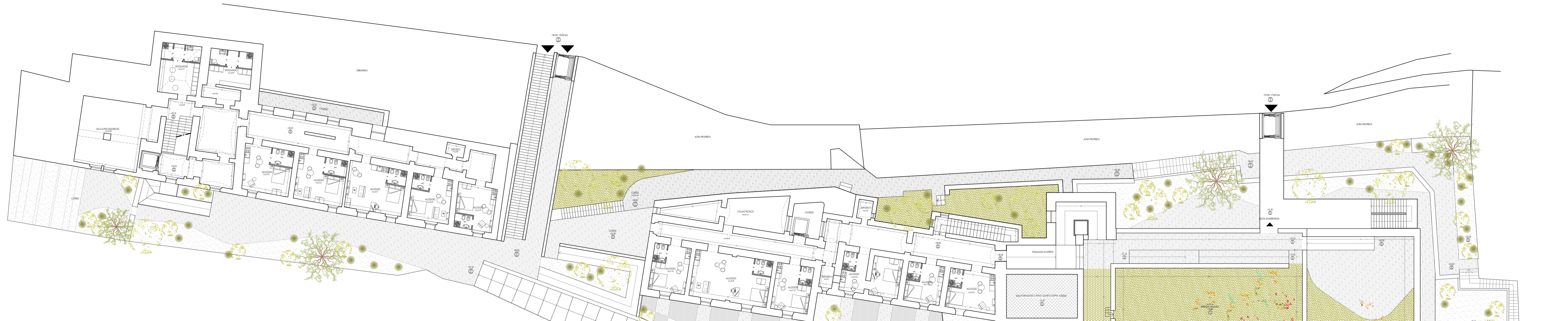
PIANTA SECONDO LIVELLO San Pietro a Maiella e San Giacomo