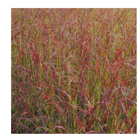
Panicum virgatum 'Shenandoah'