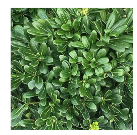
Pittosporum tobira 'Nana'