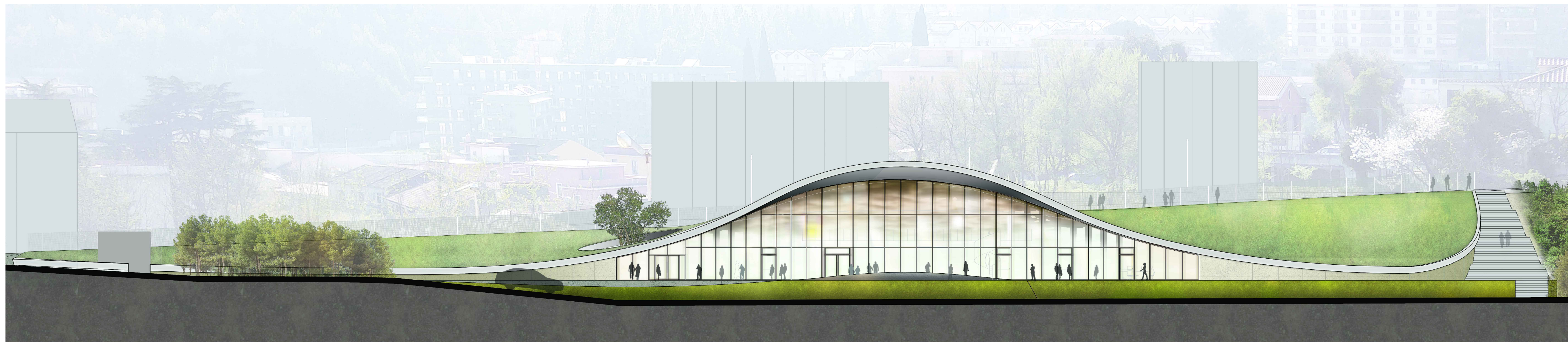
PP 01 PROSPETTO AMBIENTALE OVEST Scala 1:200

NOTE AL PROGETTO ESECUTIVO ARCHITETTONICO: Tutti gli elaborati generali sono stati redatti per consentire una visione di insieme del progetto e per consentire l'individuazione degli elaborati a scala maggiore. In caso di discordanza tra gli elaborati, prevalgono le informazioni contenute negli elaborati a scala maggiore. Le quote indicate dovranno essere verificate e fatte proprie dall'impresa. Eventuali discordanze significative dovranno essere immediatamente comunicate alla Direzione Lavori ed ai progettisti prima di procedere. Le indicazioni riportate in merito alle strutture sono da ritenersi qualitative: fare riferimento al progetto esecutivo strutture (elaborati ST). Le indicazioni riportate in merito agli impianti meccanici sono da ritenersi qualitative: fare riferimento al progetto esecutivo impianti meccanici (elaborati IM). Le indicazioni riportate in merito agli impianti elettrici sono da ritenersi qualitative: fare riferimento al progetto esecutivo impianti elettrici (elaborati IE). Per quanto riguarda il posizionamento dei corpi illuminanti, i disegni costruttivi che saranno redatti dal fornitore dovranno tenere conto di quanto riportato negli elaborati architettonici e dovranno essere verificati dal progettista impianti elettrici per quanto riguarda il rispetto delle richieste prestazionali. Gli arredi sono rappresentati per verificare l'arredabilità degli ambienti e non sono compresi nell'appalto di costruzione.