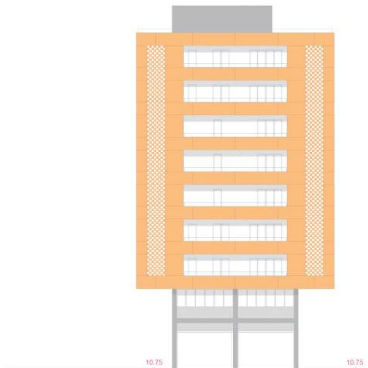
PROGETTO - PROSPETTO "D" "SCALA A" VIA PICIENZA - 1:200