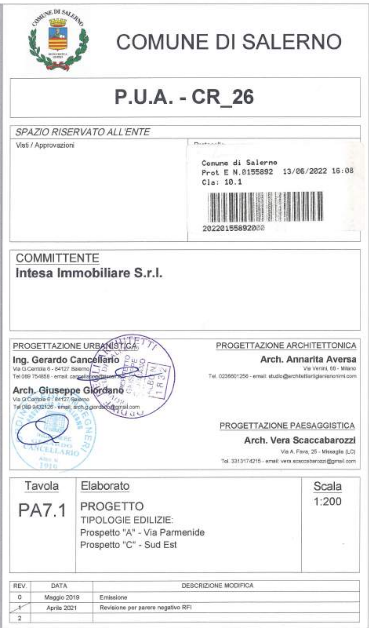
PROGETTO - PROSPETTO "A" VIA PARMENIDE - 1:200