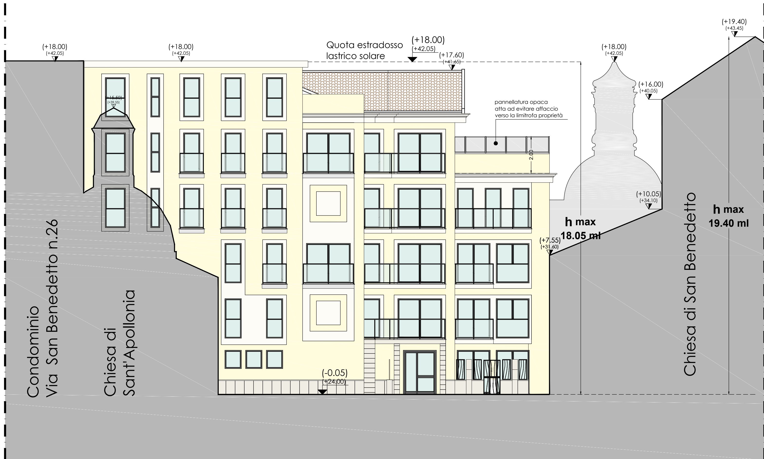
PROSPETTO SUD - su corte interna