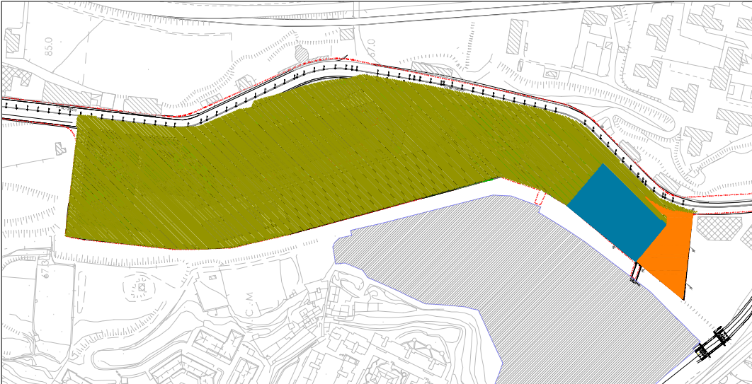
STRALCIO II scala 1:5000