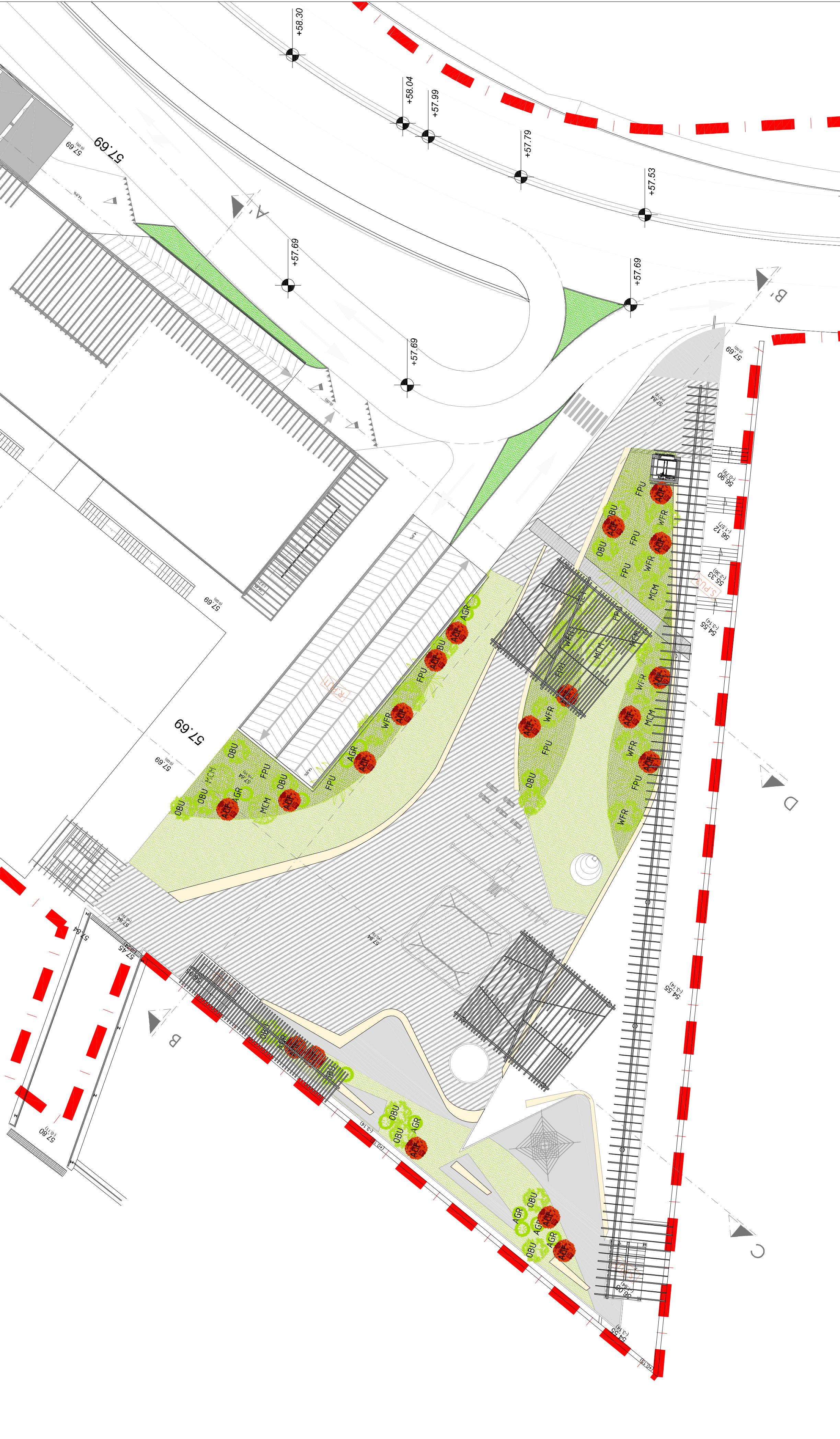
INDIVIDUAZIONE DELLE ESSENZE: STRALCIO Pianta A QUOTA +73.47 s.l.m. 1:200